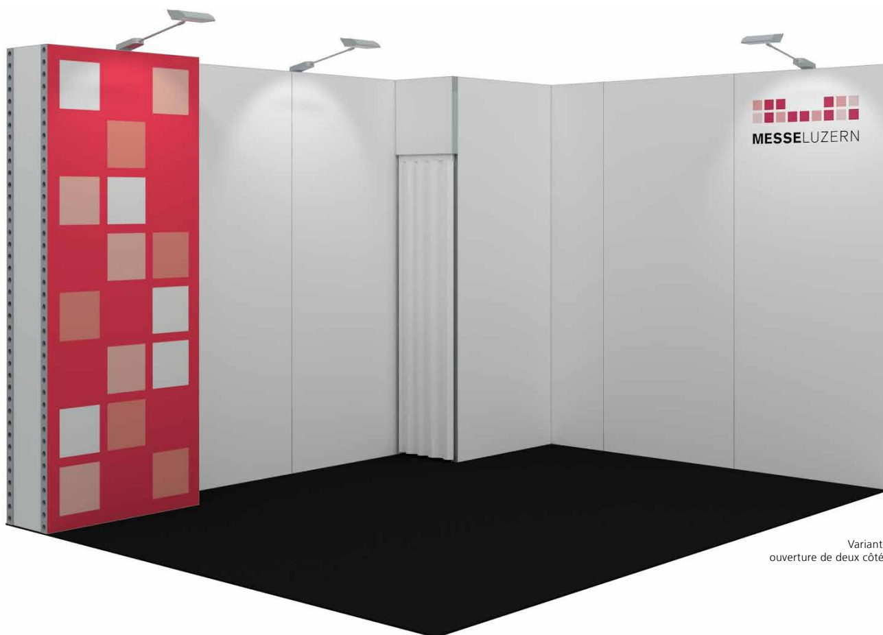
Variante ouverture de deux côtés

Moderne et fonctionnel: Ce stand modulaire offre une meilleure visibilité à votre message.